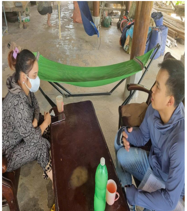
Phổ biến quy trình giám sát cho các trưởng bản