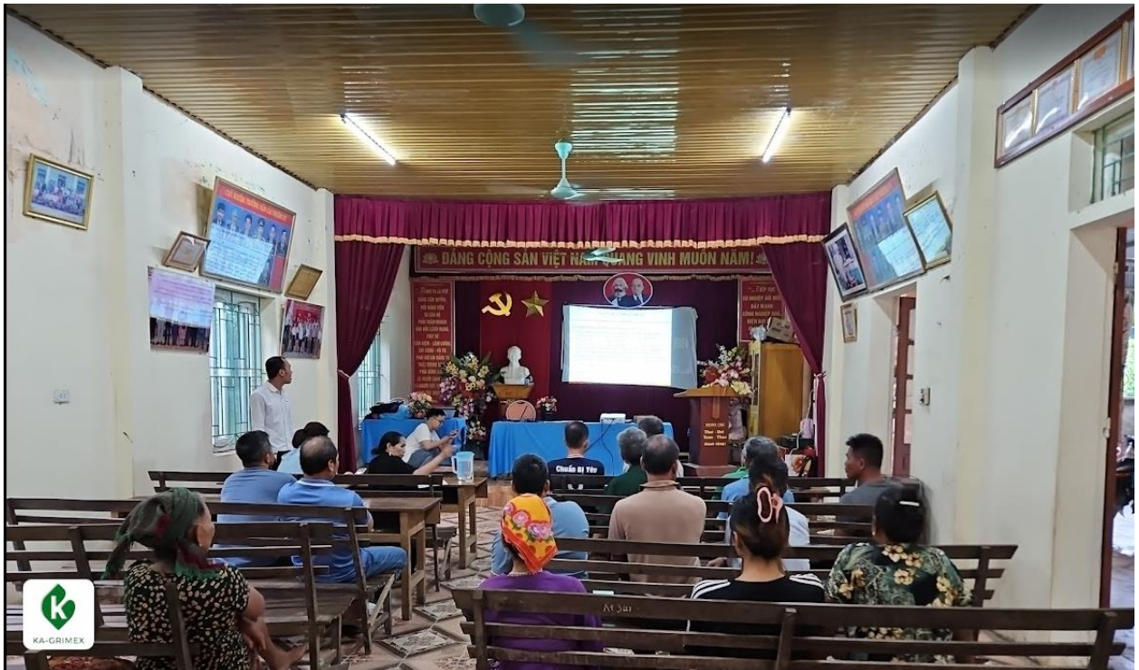
Tập huấn về Bộ tiêu chuẩn FSC và Thảo luận về các tác động Môi trường – Xã hội do hoạt động SXLN gây ra