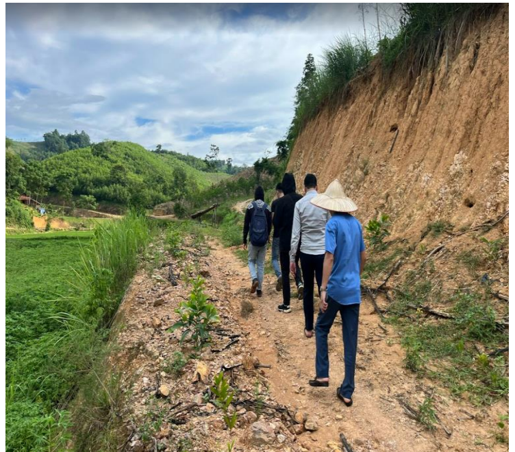
Tập huấn Giám sát và Thực hành Giám sát cùng Ban Đại diện Nhóm CCR và trưởng bản