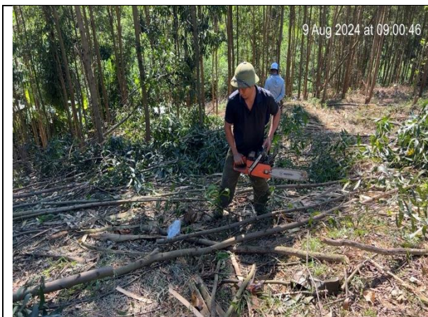
H5. CN khai thác ko mang đồ BHLĐ tại Chi Khê

Công nhân khai thác chưa được trang bị đầy đủ phương tiện, đồ bảo hộ lao động Hiện trường khai thác có nhiều gốc cắt chưa đúng kỹ thuật khai thác tác động thấp Phỏng vấn một số công nhân khai thác được biết họ chưa được tập huấn về Khai thác tác động thấp và ATLĐ trong các hoạt động lâm nghiệp