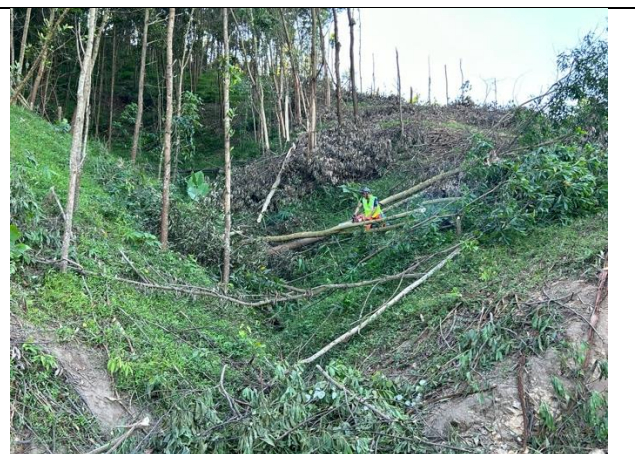
H6. CN khai thác trang bị đồ BHLĐ đảm bảo tại Thạch Ngàn.