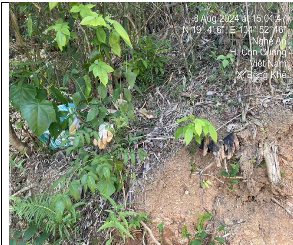
H3. Rác thải trên lô rừng