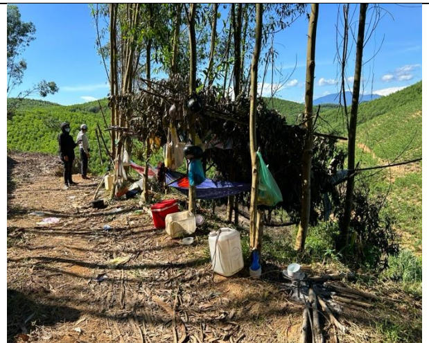
H4. Rác thải tại khu vực lán trại tổ khai thác